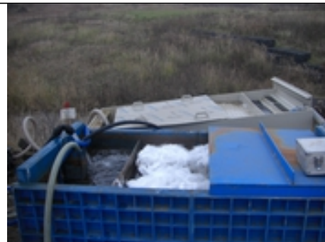
Sanační čištění čerpaných vod

Práce na zakázce byly provedeny dle schváleného prováděcího projektu, v požadované kvalitě v souladu s realizační smlouvou a ve smluvně dohodnutých parametrech.