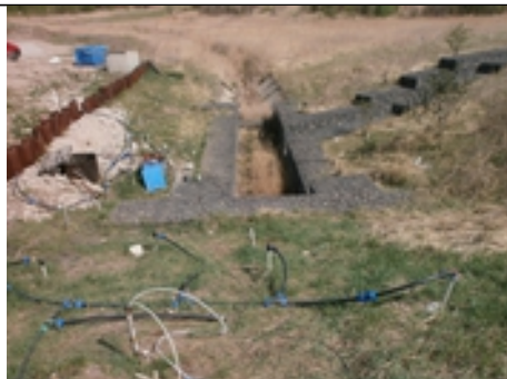
Pohled na lokalitu s aplikačními rozvody